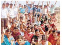
परिक्षा सेंटर को लेकर प्रदर्शन पेज-16