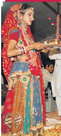
कांठे उमर अजी